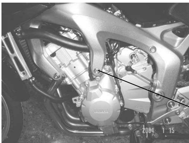
PUNTO DE FIJACIÓN SUPPORT POINT

Dismount the fixation screws from the chassis to the engine in the support point marked on the picture (and the opposite side). Mount the crash pads on each own side as the figure shows, using the supplied screws. Once pressed, place the lids (1).